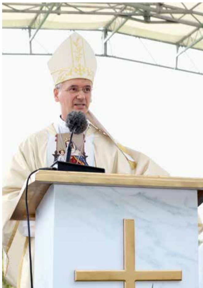
Splitsko-makarski nadbiskup i metropolit mons. Dražen Kutleša: - Uglledajmo se u Mariju i dopustimo Bogu da nas preobrazi na takav način da niti što pitamo niti što hoćemo što ne bi bilo u skladu s Božjom voljom. U tome je savršeno ostvarenje čovjekove slobode: htjeti samo dobro, biti nesposobni za zle izbore i čine

je savršeno ostvarenje čovjekove slobode: htjeti samo dobro, biti nesposobni za zle izbore i čine. Sve dok mogu izabrati zlo ja nisam istinski slobodan čovjek. Rečeno modernim žargonom, samo se u tom savršenom ostvarenju čovjekove slobode