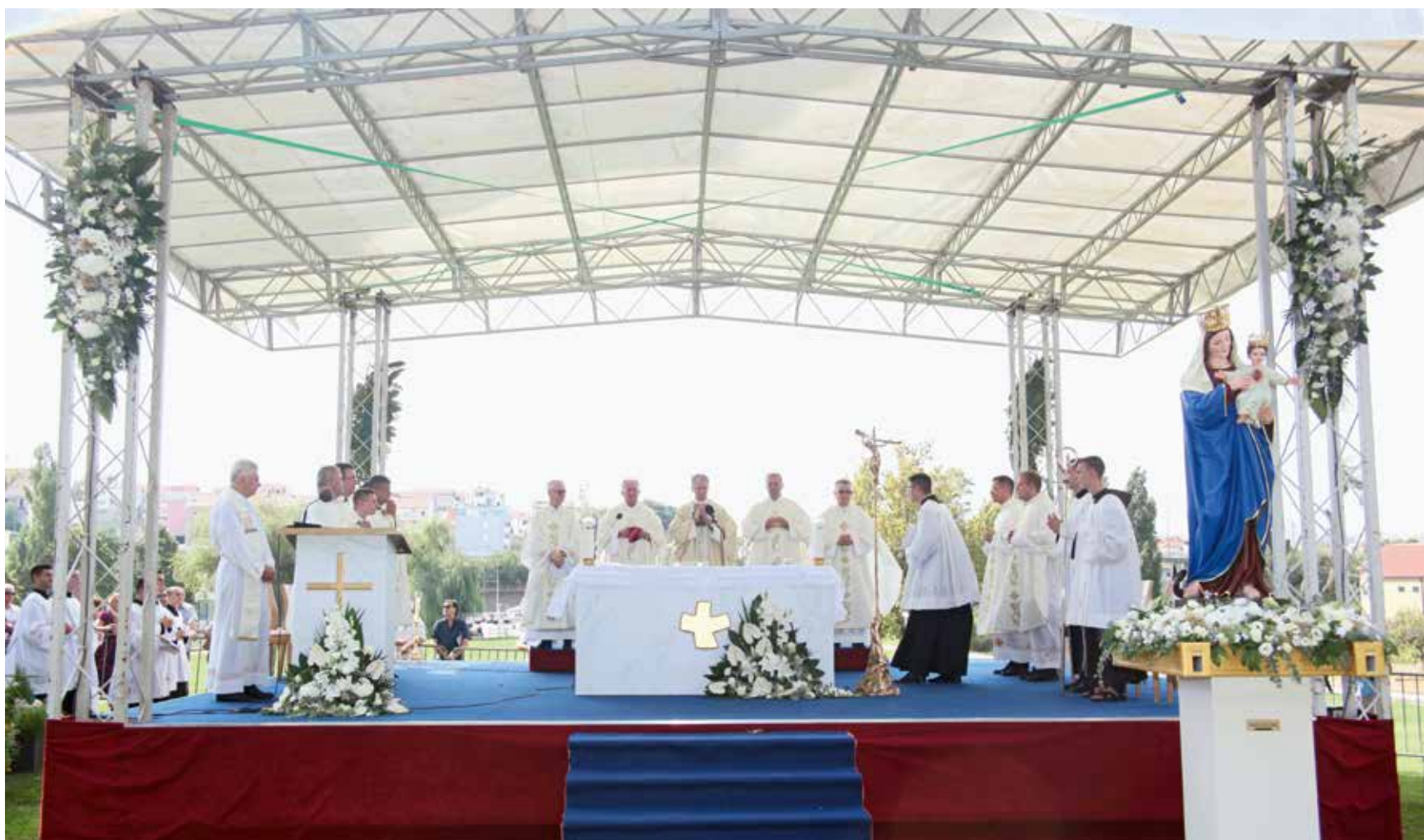
Središnje euharistijsko slavlje pred crkvom Gospe od Otoka predvodio je splitsko-makarski nadbiskup i metropolit mons. Dražen Kutleša u koncelebraciji s hvarskim biskupom mons. Rankom Vidovićem, provincijalom Franjevačke provincije Presvetoga Otkupitelja fra Markom Mršom, župnikom i upraviteljem Svetišta Gospe od Otoka don Antom Čotićem i ostalim svećenicima

Marija je učenica i učiteljica vjere. U trenutku kad je Gospodinu dala posvemašnji pristanak vjere, nije joj bilo otkriveno sve. Sabirala je i čuvala sve te iznimne događaje u svome srcu,