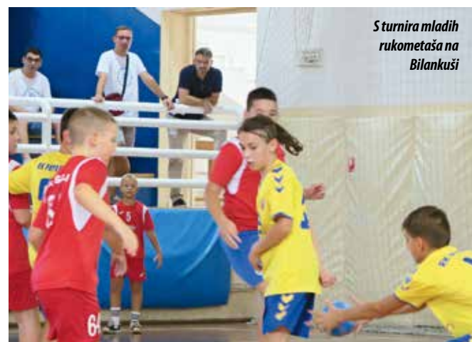
Sturnira mladih rukometaša na Bilankuši

RUKOMET – RK SOLIN: ODRŽAN TURNIR DJEČAKA U11 I U13 – VOLIM RUKOMET, VOLIM SPORT!