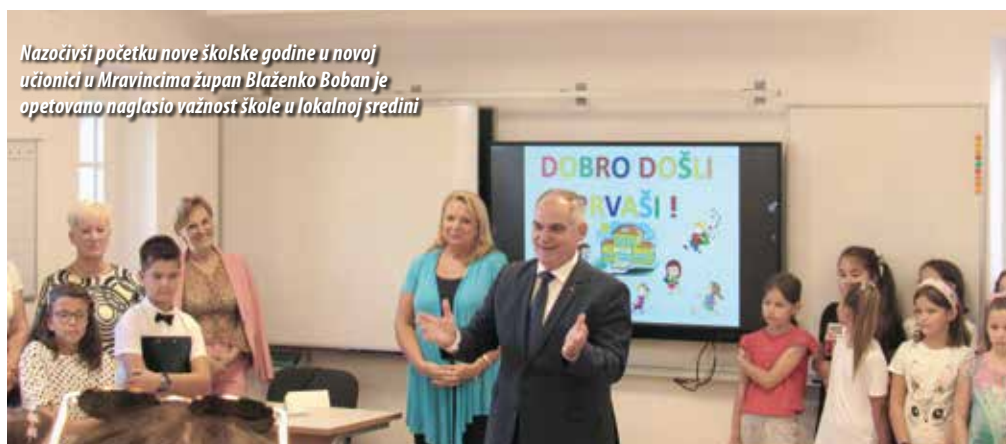
Nazočivši početku nove školske godine u novoj učionici u Mravincima župan Blaženko Boban je opetovano naglasio važnost škole u lokalnoj sredini

Pročelnik županijskog Upravnog odjela za prosvjetu, kulturu, tehničku kulturu i sport Tomislav Đonlić ocijenio je kako se i u čitavoj županiji znatno osjeti pad broj upisanih učenika, ali ne mjeri kako je u drugim županijama. Štoviše broj prvšaća uvelike ovisi o velikom broju odgođenih upisa u prvi razred osnovne škole, a što će se u narednoj školskoj godini poručuju iz Županije regulirati.