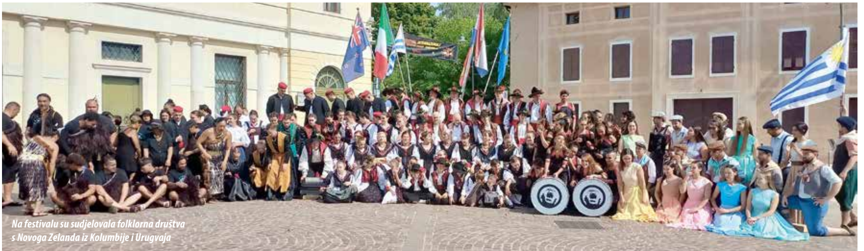
Na festivalu su sudjelovala folklorna društva s Novoga Zelanda iz Kolumbije i Urugvaja

KUD »SALONA« NA 54. MEĐUNARODNOM FESTIVALU FOLKLORA AVIANO – PIANCEVALLO