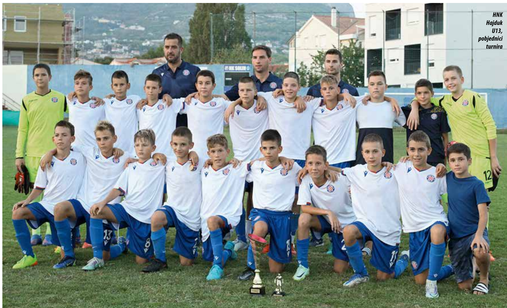
HNK Hajduk U13, pobjednici turnira

MEMORIJALNI TURNIR: ODRŽAN 26. NOGOMETNI TURNIR DJEČAKA U-13 "TONČI BOBAN BEBI" SOLIN 2022.