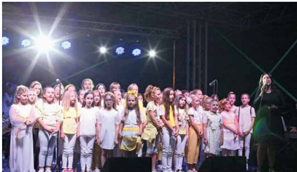
Posebno oduševljenje kod publike izazvao je nastup Dječjega zbora Gospe od Otoka