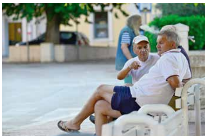
Odmor i rehabilitacija za članove su organizirani u Istarskim toplicama

Svijetli trenutak solinske svakodnevice godina su dječja graja u vrtičkim kućama i simpatična zbunjenost prvoškolaca. Odrastanje u Solinu dužni smo učiniti radosnim i sigurnim, privilegija je baštiniti povijest i kulturu prostora danoga nam na čuvanje za naraštaje koji dolaze.