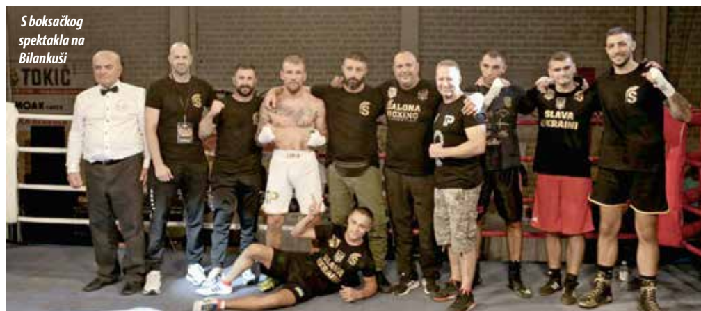
S boksačkog spektakla na Bilankuši

Tako je 1. rujna počela intenzivna boksačka sezona. Nažalost otpao je meč Branimira Malenice u Solinu. Svi oni treniraju u BK Salona pod vodstvom ukrajinskog stručnjaka Jaroslava Podmasterchyka i solinskih trenera Tomislava Bašića i Stanka Ninčevića. Uz šest profesionalnih mečeva u Solinu održani su i mečevi u olimpijskom boksu u uvodnim borbama.