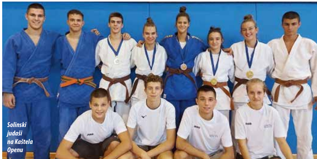
Solinski judaši na Kaštela Openu