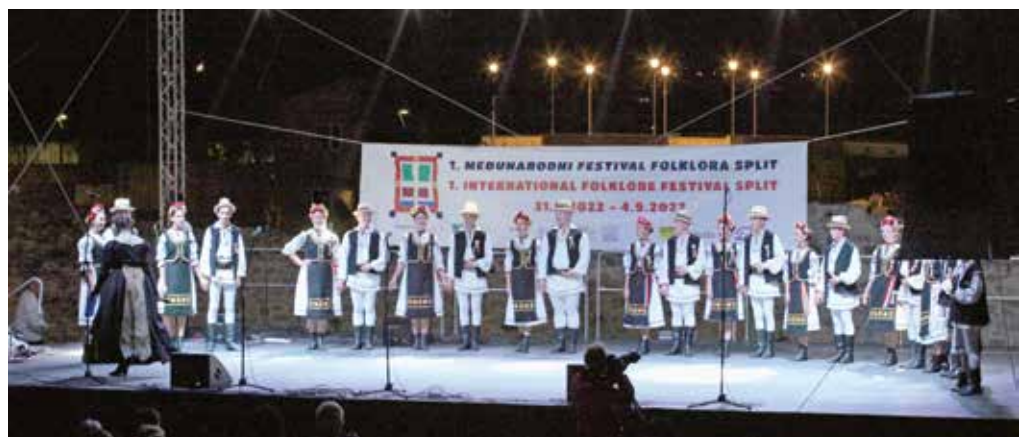
Međunarodni festival se odvijao u organizaciji Folklornog ansambla »Jedinstvo«, Javne ustanove u kulturi »Zvonimir« Solin i Splitsko-dalmatinske županije