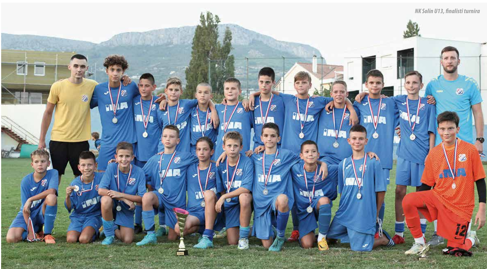
NK Solin U13, finalisti turnira