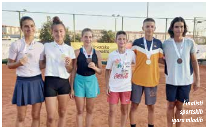
Finalisti sportskih igara mladih