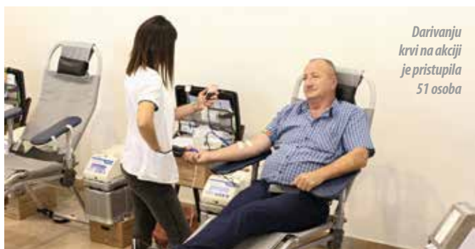
Darivanju krvi na akciji je pristupila 51 osoba

Udruge na adresi Zvonimirova 35 ili putem telefona broj 261-158 utorkom i četvrtkom u vremenu od 8,30 do 9,30 te na mobitel broj 098/97 22 455. Prijavu je moguće izvršiti do popunjena ukupne brojke od 50 mjesta koliko ih je predviđeno.