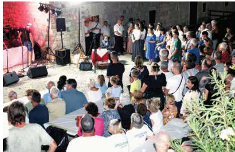
Nakon prigodnoga programa okupljeni su imali priliku uživati u dobroj spizi

NA SOLINSKOJ LJETNOJ POZORNICI NASTUPIO »KRIES« I MOJMIR NOVAKOVIĆ