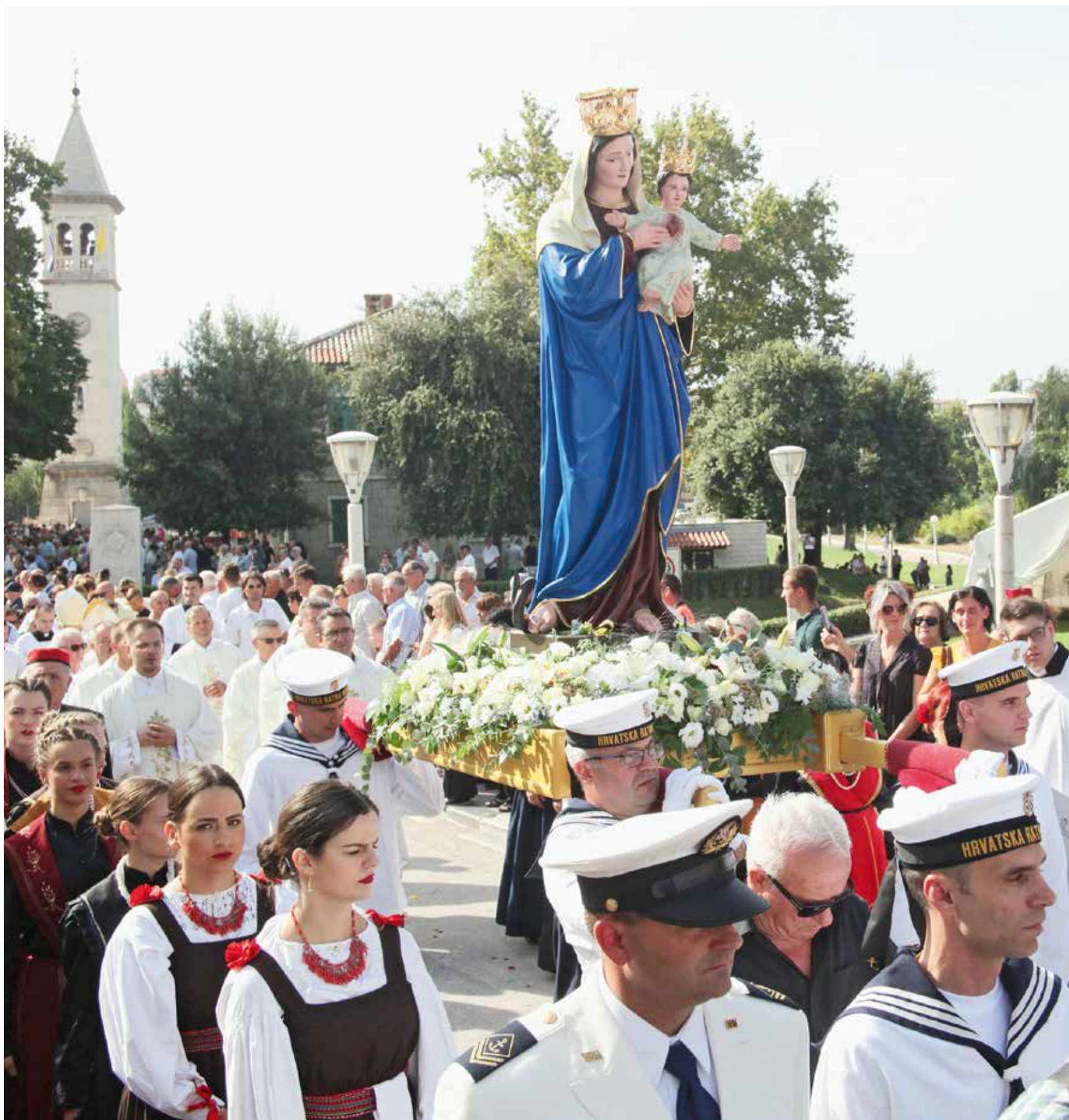
Jutarnjem svečanom euharistijskom slavlju prethodila je tradicionalna procesija s Gospinim kipom ulicama grada Solina

Ugledajmo se u nju i dopustimo Bogu da nas preobrazi na takav način da niti što pitamo niti što hoćemo što ne bi bilo u skladu s Božjom voljom. U tome je savršeno ostvarenje čovjekove slobode: htjeti samo dobro, biti nesposobni za zle izbore i čine. Sve dok mogu izabrati zlo ja nisam istinski slobodan čovjek. Rečeno modernim žargonom, samo se u tom savršenom ostvarenju čovjekove slobode dodiruju »pro choice i pro life« usmjerenja: izbor tada postaje, izbor za život – rekao je nadbiskup Dražen Kutleša