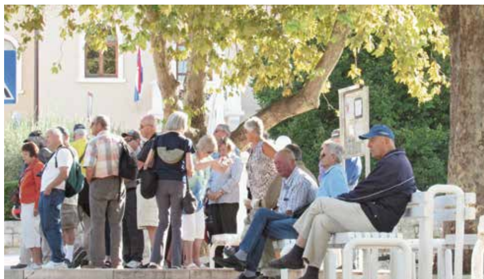
Imajući u vidu profil turista koji posjećuju i odsjedaju u našem gradu, dodatna promišljanja u vidu strategije razvoja su nezaobilazna

Suživot gosta i domaćina ni u Solinu nije uvijek idila. Trezveno promišljanje o strategiji razvoja destinacije obaveza je svih aktera pa ako su neki i propustili najbolji odabir trenutka, kod nas je zadnji vlak krenuo, ali i još ga možemo stići