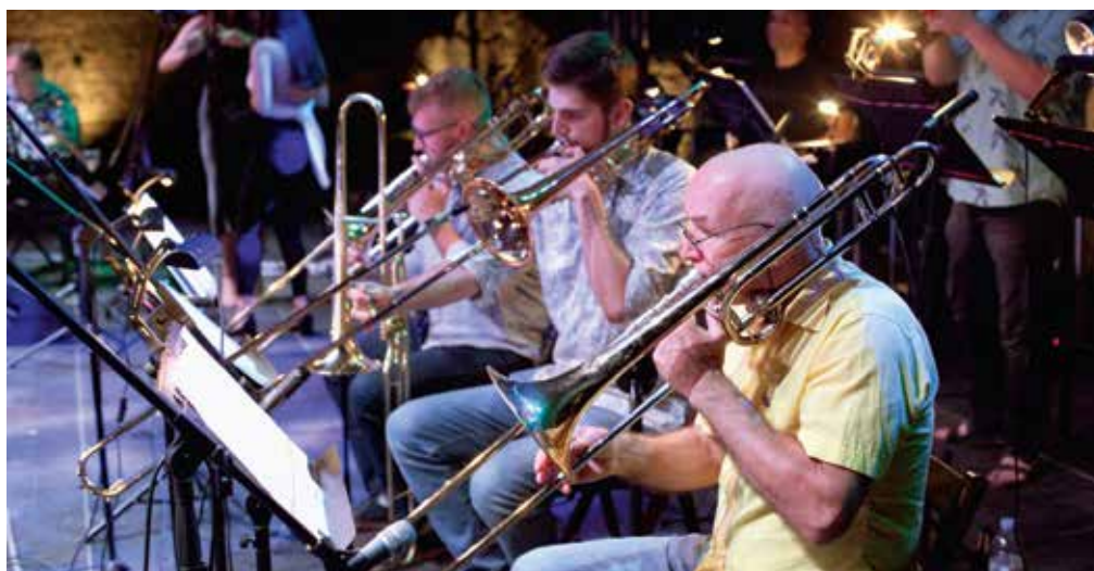
Festival se od svoga početka održava pod visokim pokroviteljstvom Svjetske organizacije puhačkih orkestara i ansambala, distrikta za Srednju i Istočnu Europu

U solinskoj je Gradini 27. kolovoza održan 6. festival puhačkih orkestara »Solín Brass Fest 2022.« kojega organizira Gradska glazba »Zvonimir« Solin. Festival je pokrenut 2017. i na njemu su do sada nastupili brojni orkestri i brass ansambli iz Hrvatske, ali i iz inozemstva. U proteklih pet izdanja u Solinu su uz hrvatske orkestre iz Zagreba, Imotskog, Petrinje, Vodica i Križevaca, gostovali orkestri iz Slovenije, Mađarske, Rusije i Bosne i Hercegovine. Ovogodišnje izdanje festivala posvećeno je 110. godišnjici Gradske glazbe »Zvonimir« Solin.