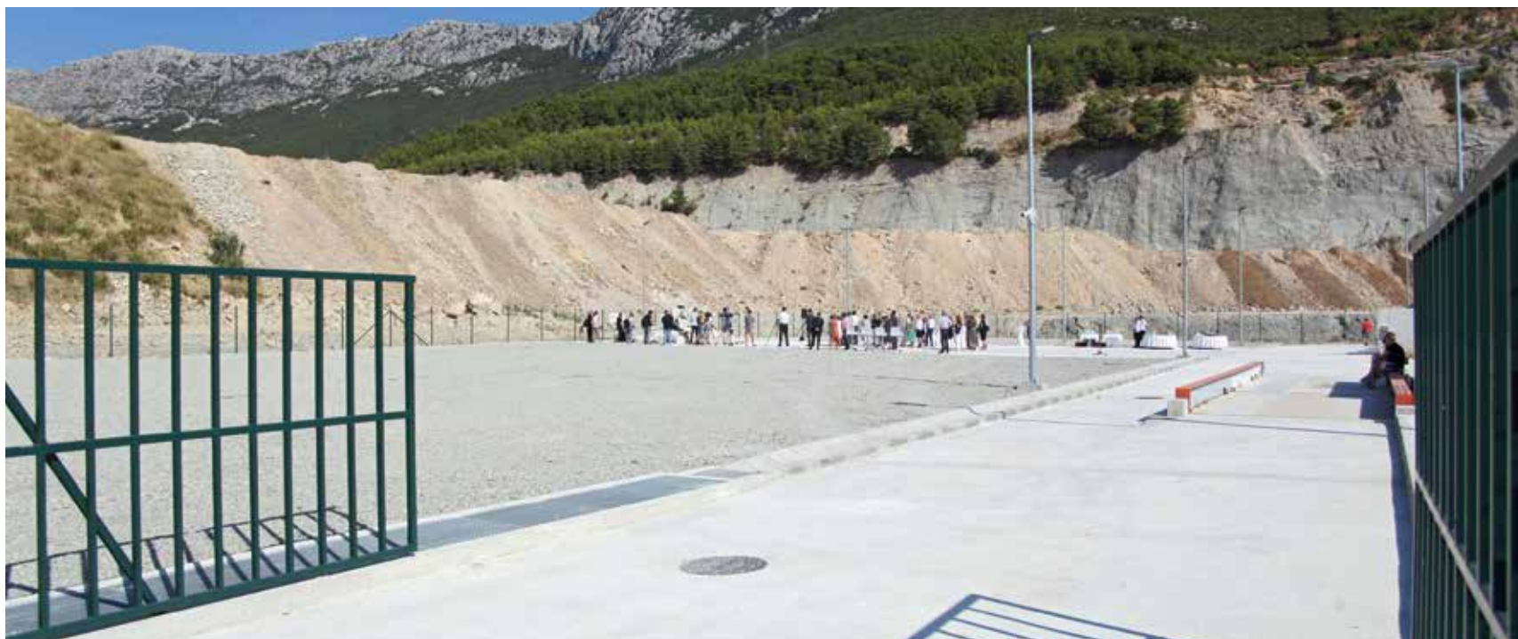
Reciklator, reciklažno dvorište za građevni otpad uz tvrtku »Cemex« Hrvatska ide ukorak s najnovijim zahtjevima tržišta

Potpisivanjem Kodeksa još jednom je potvrđena predanost transparentnosti i poštenim poslovnim odnosima te olakšana prilagodba uvođenju euru kupcima i partnerima