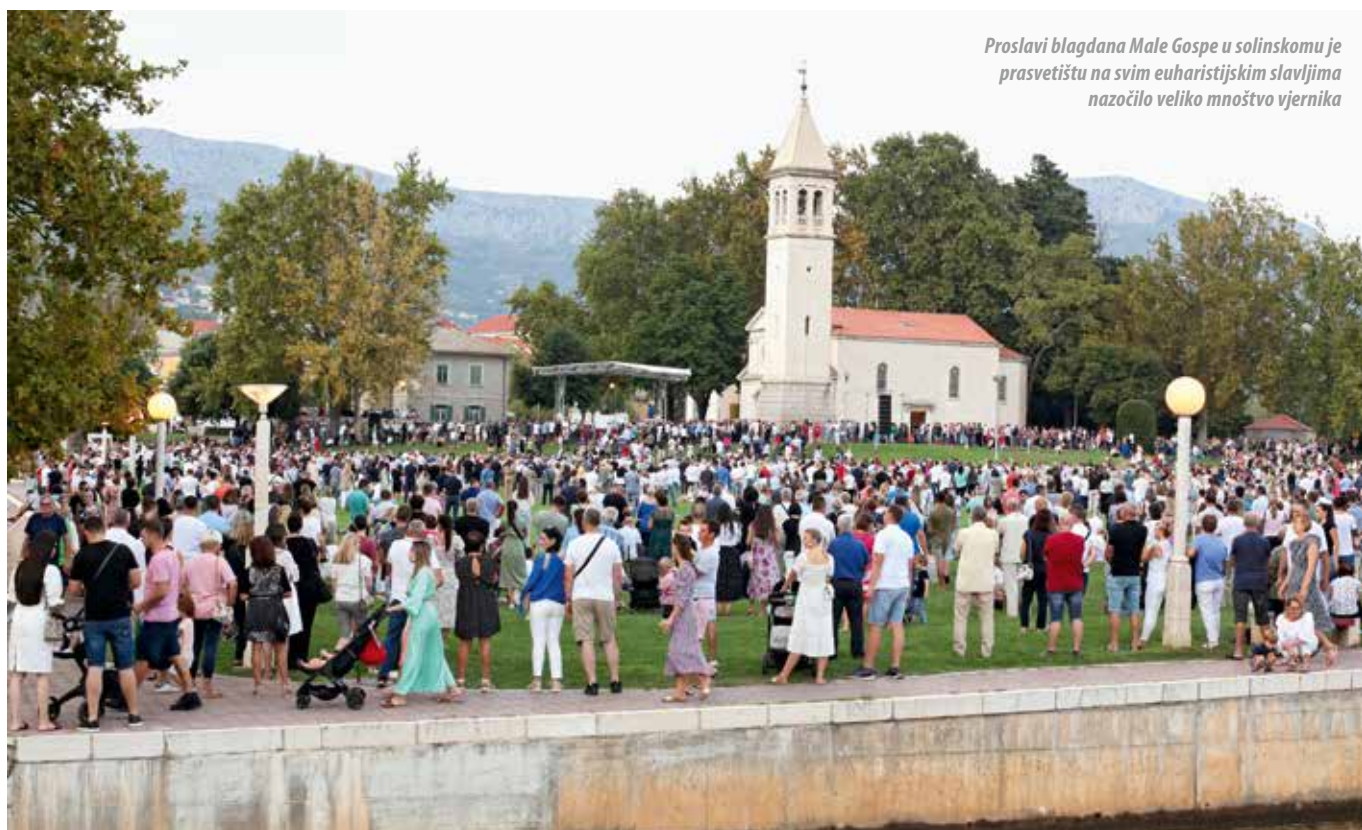
Proslavi blagdana Male Gospe u solinskomu je prasnvetištu na svim euharistijskim slavljinama nazočilo veliko mnoštvo vjernika