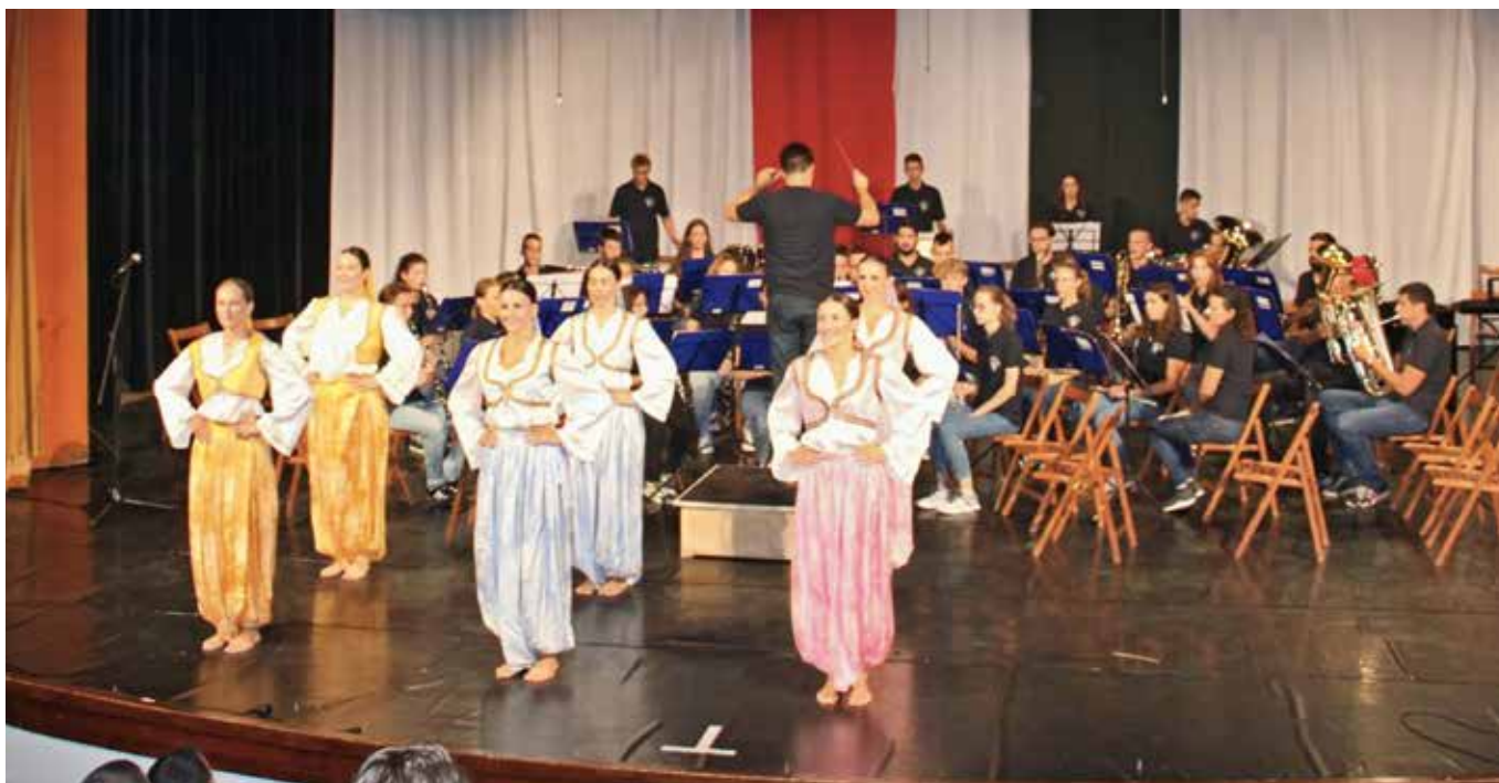
Solinske su mažoretkinje na jedinstven način upotpunile nastup solinskih glazbara