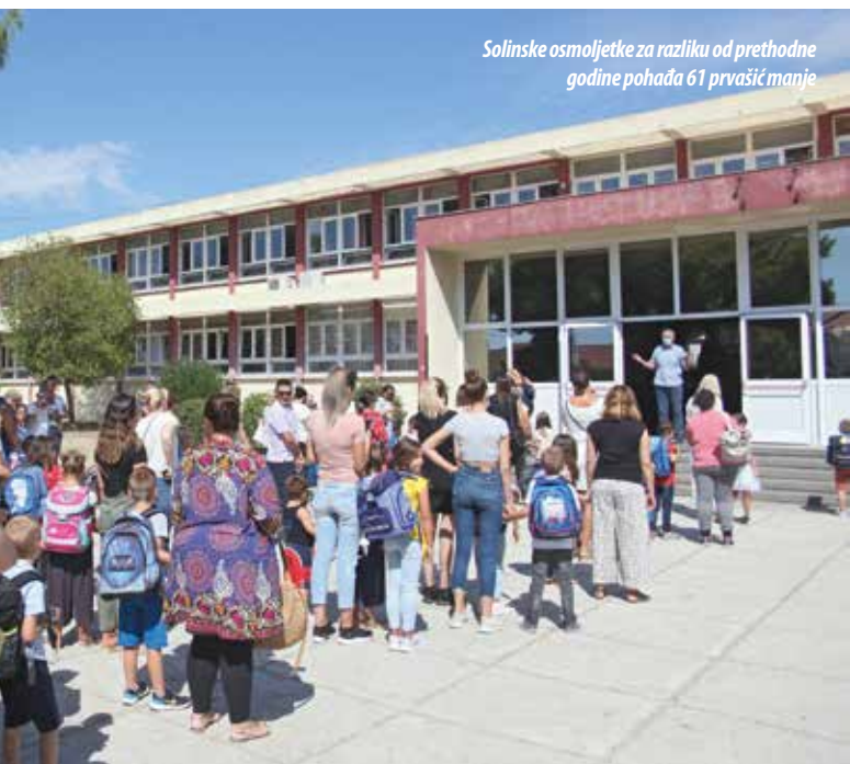
Solinske osmoljetke za razliku od prethodne godine pohađa 61 prvašić manje